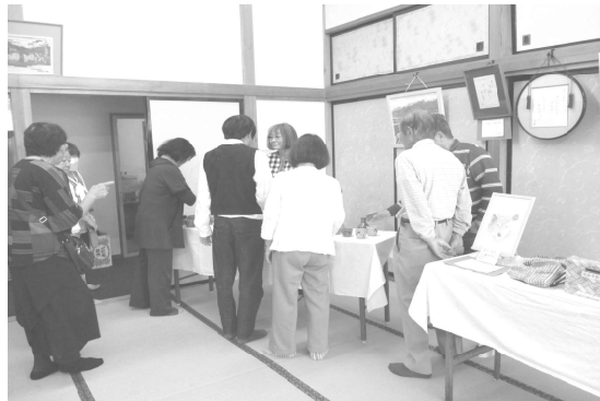
↑個性あふれる作品展示