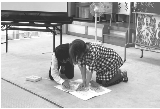
↑AED(ダミー)を使った救急救命の実演