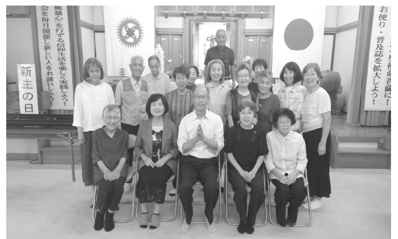
お祝いの、皆で記念撮影しよう!